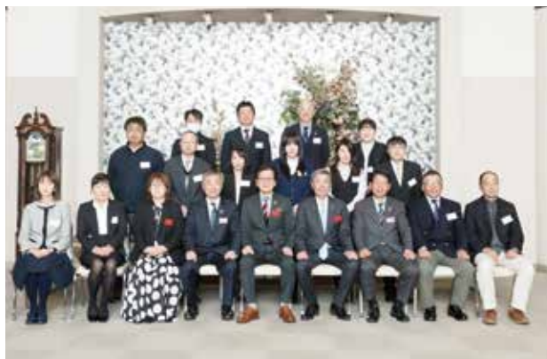
<勤続15年～45年の受賞者の皆様>

12月6日(金)、「令和6年度会員事業所永年勤続従業員表彰式」を挙行政いたしました。本年度は、勤続45年から10年までの25事業所101名の方が受賞されました。当日出席された受賞者の皆様には、小松会頭より表彰状と記念品がお一人お一人に贈られました。また、表彰式後の祝賀会にて皆様のお祝いをいたしました。