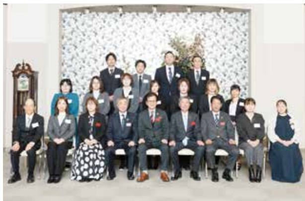
<勤続10年の受賞者の皆様>